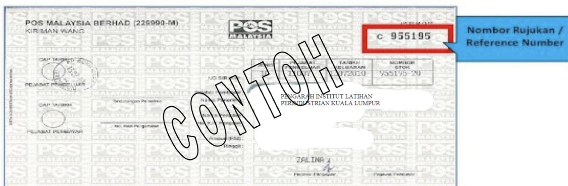
Contoh Kiriman Wang Pos